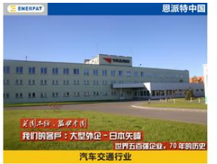
大型外企，日本爱信