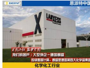
大型外企，德国朗盛