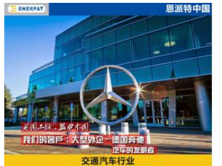
大型外企，德国奔驰