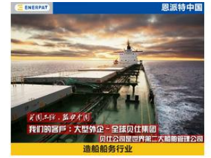
大型外企-全球贝仕