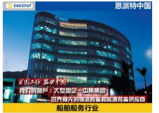
大型国企-中集集团