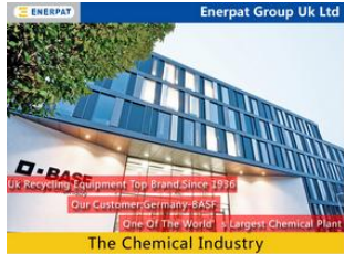
大型外企，德国巴斯夫