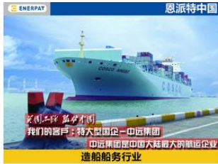
大型国企-中远集团