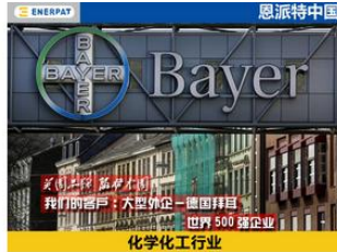
大型外企，德国拜耳