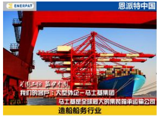
大型外企-马士基集团