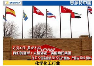
大型外企，美国陶氏