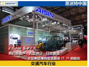
大型外企，日本爱信