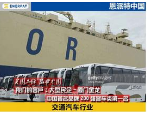
大型民企，厦门金龙